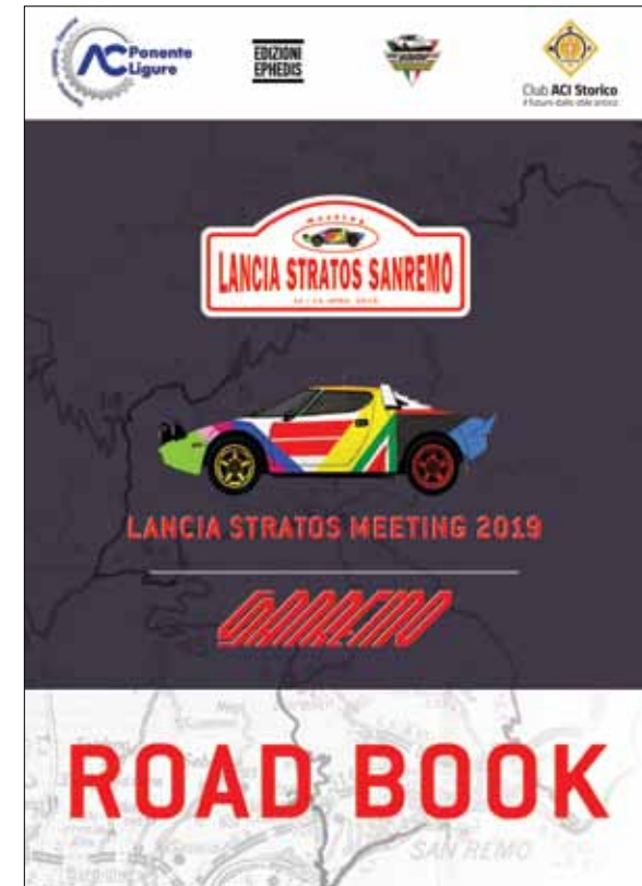
ROADBOOK STRATOS SANREMO 2019