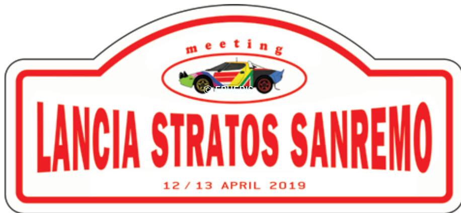
TARGA IN ALLUMINIO / ALUMINIUM PLATE